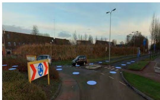
Afbeelding: Locatie Sweerssekamp voor (linker afbeelding) en na (rechter afbeelding) geluidmaatregelen