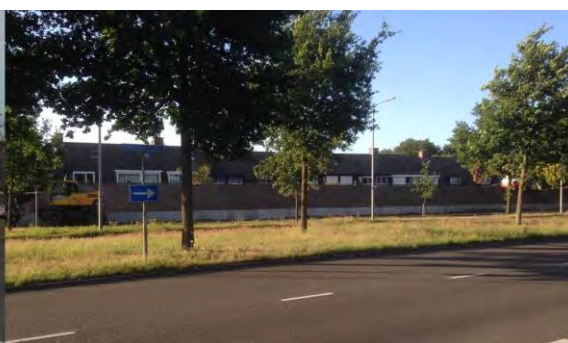
Afbeelding: Locatie Zwartewaterallee voor (linker afbeelding) en na (rechter afbeelding) geluidmaatregelen