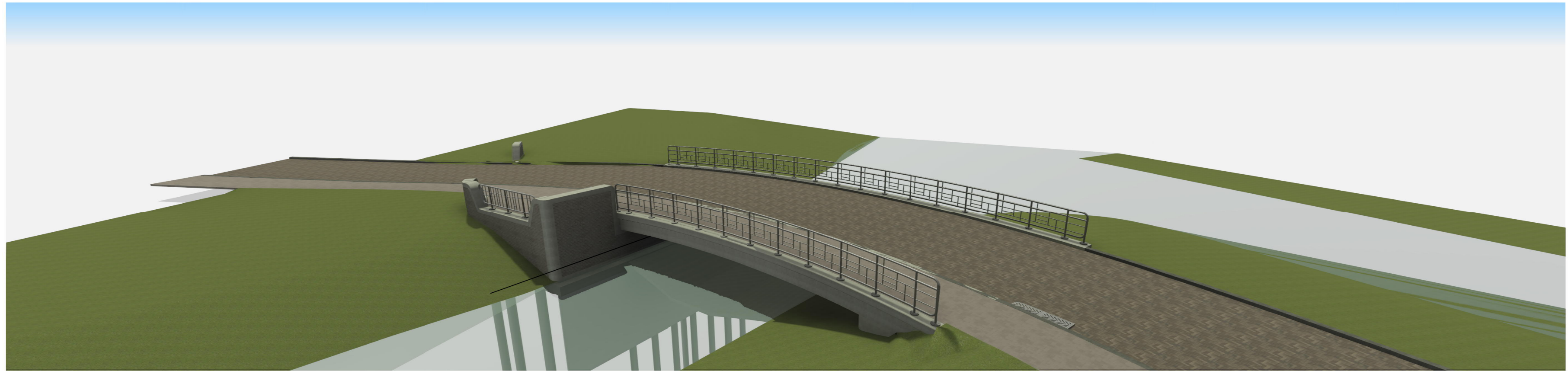
3D View 1