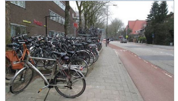
Ooster- en Westerlaan bestaand en beoogde impressies. Beiden gezien vanuit hetzelfde standpunt