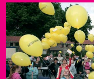
Start van De Smederijen