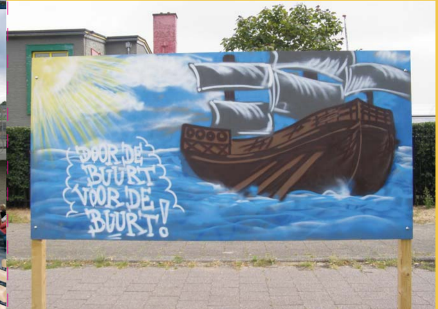
Kunst in de buurt