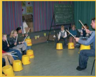
Muzikale vormingslessen op school

"Het project De Smederijen van Hoogeveen heeft ons veel opgeleverd. In de eerste plaats zijn de bewoners veel meer betrokken geraakt bij het wel en wee van hun wijk. Ze zien namelijk dat ze daadwerkelijk invloed kunnen uitoefenen en dat stimuleert geweldig. Maar ook de samenwerking tussen de gemeente, de woningcorporaties, het welzijnswerk en de politie is door dit project sterk verbeterd. Daarnaast heeft er in de afgelopen periode een culturomslag plaatsgevonden binnen de gemeente.