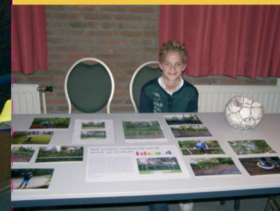
Ook de jeugd komt met ideeën

een stuk prettiger wonen. Dat komt niet alleen door de output, zoals een kalender of een muziekinstallatie op een hangplek, maar vooral door het proces daar naartoe. Mensen raken sociaal geactiveerd, ondernemen actie en krijgen weer vertrouwen. Heel mooi om te zien! ”