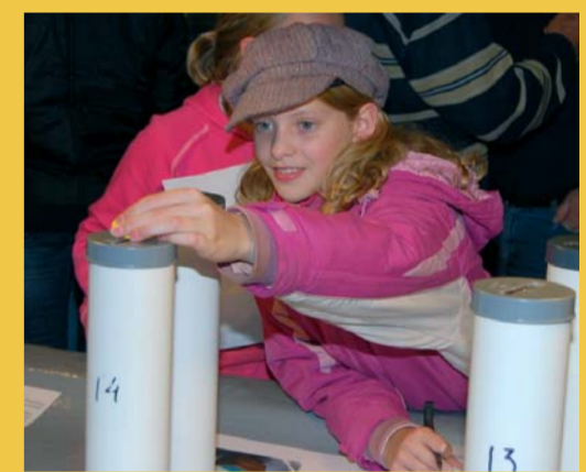
Kinderen mogen ook stemmen