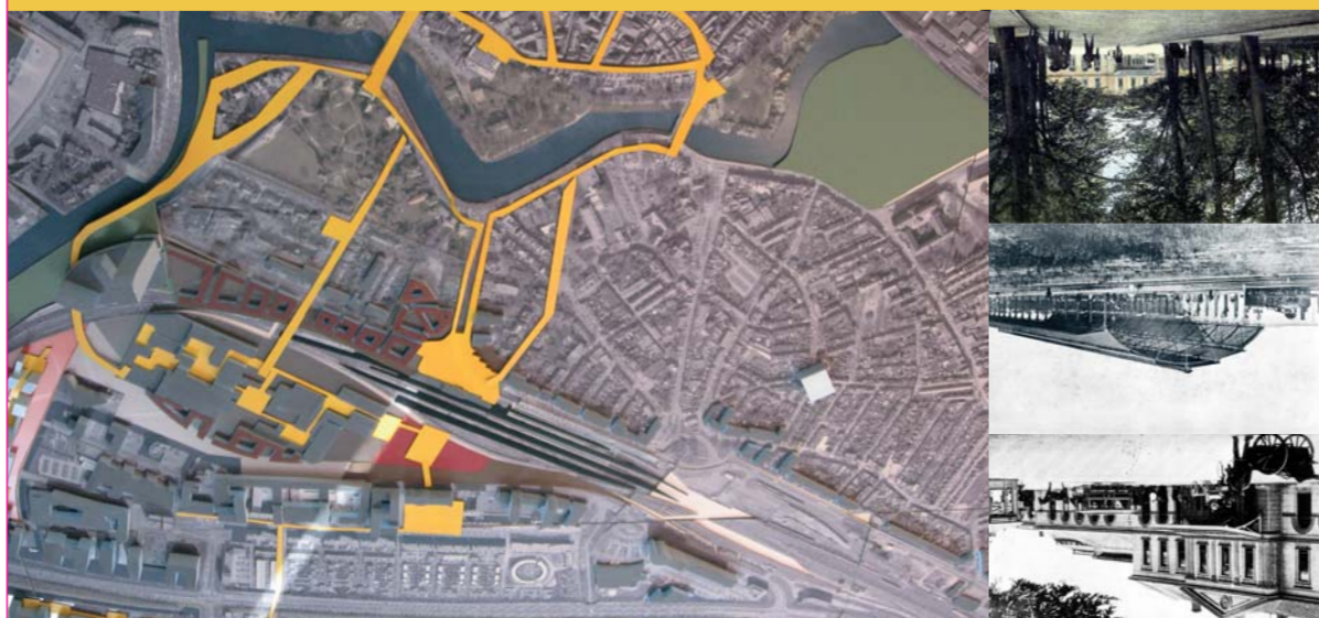
Werkmaquette Spoorzone: deel Stationsgebied