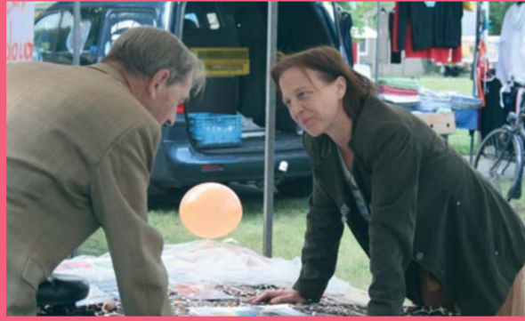
Bewoners presenteren hun verkiesbare ideeën aan de buurt