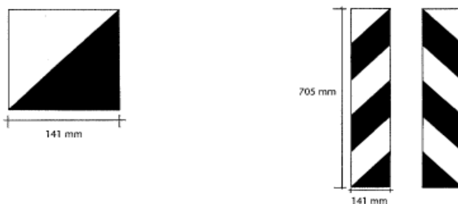
Figuur 5. Maatvoering van de diagonaal aan te brengen rode en witte vlakken