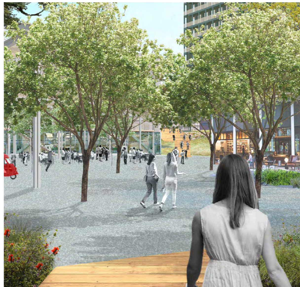
Het Hanzeplein verandert in een groen en stedelijk plein. Dit plein is het centrale hart van het Hanzekwartier.