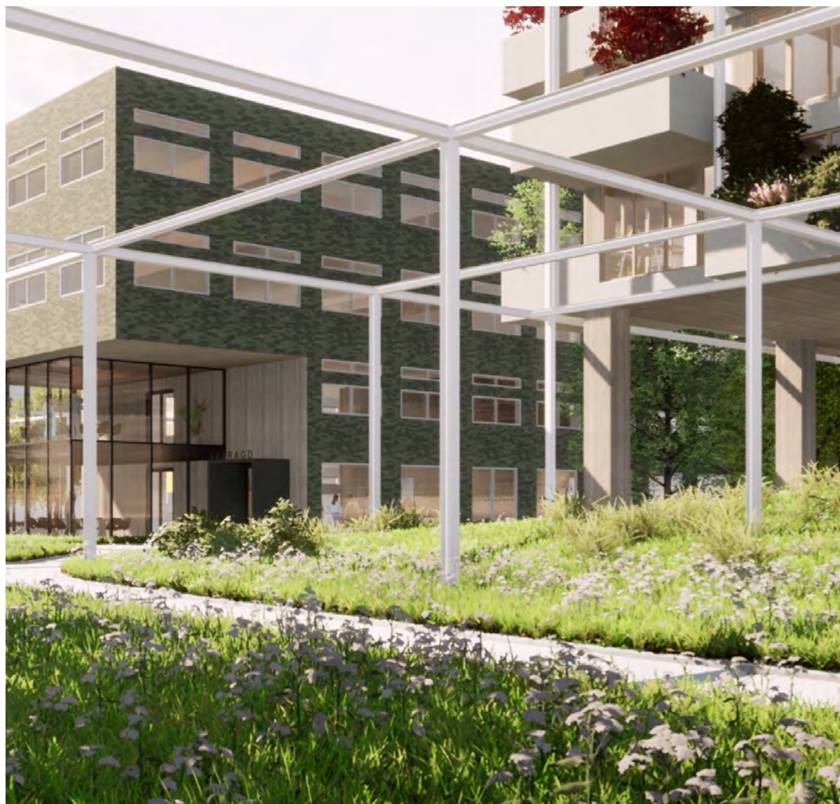
Aan de Noordzeelaan komen tussen de bestaande gebouwen nieuwe gebouwen, waaronder woningen. Ook hier wordt de omgeving groener.