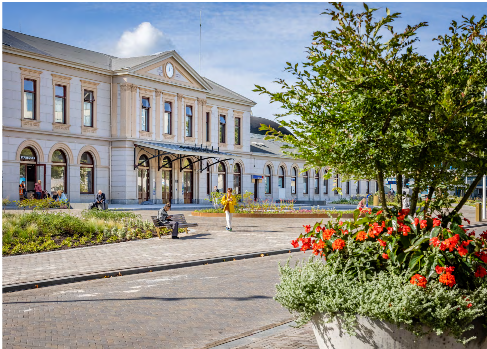
De prachtig vernieuwde voorgevel van het stationsgebouw, nu omgeven door sprankelend groen

Het station is nu veel meer dan alleen een plek waar je op de trein stapt. De stationshal is omgevormd tot een plek waar je op een prettige manier kunt wachten op de trein, werken of anderen