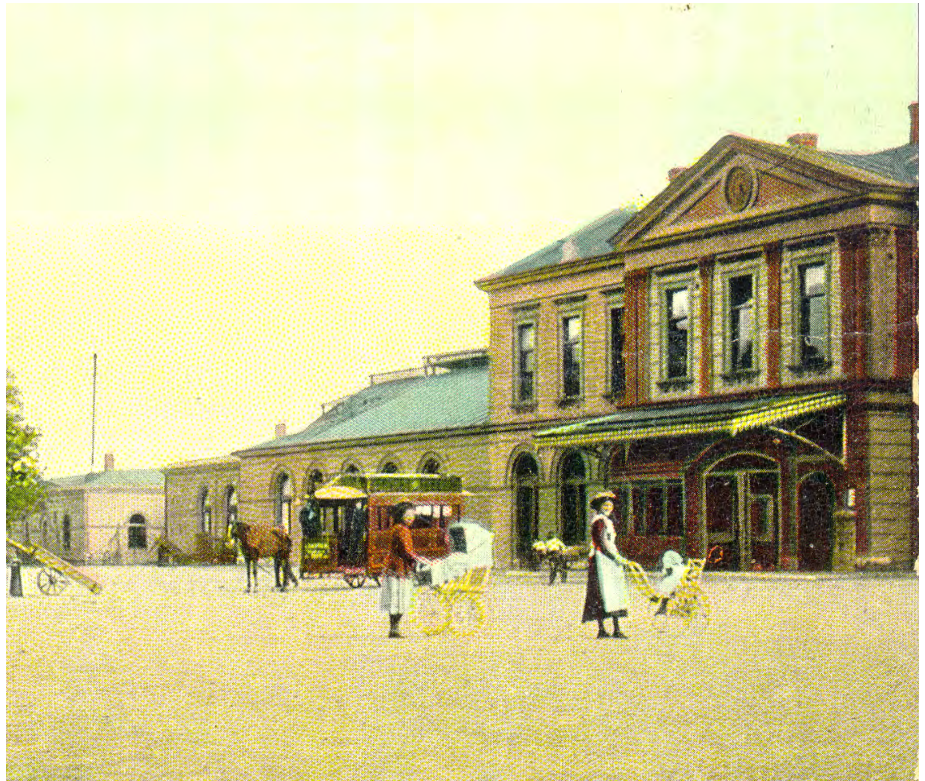
Een kleurenplaatje (ingekleurde litho) van het stationsgebouw, uit 1908

Nu de werkzaamheden zijn afgerond en de huurders hun winkels hebben afgebouwd, kun je weer van 's ochtends vroeg tot 's avonds laat terecht in de winkels van het stationsgebouw. Voor een heerlijk bakje koffie, een broodje, een cadeautje of een heerlijke pizza bij Luca's.