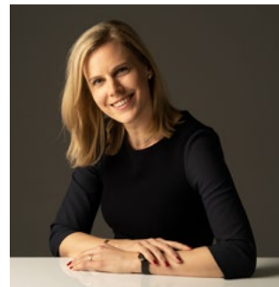
Dorrit de Jong Inclusieve samenleving

Wij wensen u wederom veel leesplezier met deze nieuwe halfjaarrapportage.