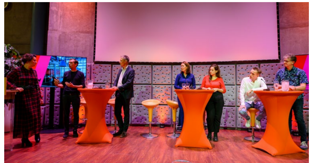
Stadsdialoog Zwolle armoedevrij

Om de raad en diverse betrokkenen te informeren over de resultaten van de Doorbraakmethode is een uitgebreide video gemaakt voor bij de informatienota. Deze was in overleg met de betrokken inwoner tot 1 maart te zien. Daarnaast is een verkorte versie gemaakt die nog steeds hier te bekijken is.