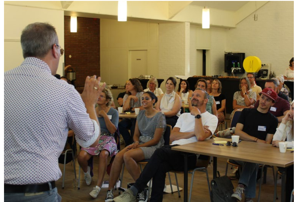
Werk- en inspiratiebijeenkomst Afwegingskader jeugdhulp

Vanuit het project Afwegingskader jeugdhulp is een voorstel voor een gewijzigde Verordening Jeugdhulp Zwolle in voorbereiding. Deze zal in het voorjaar van 2023 voorgelegd worden aan de Participatieraad en vervolgens ter besluitvorming aan de raad worden gezonden.